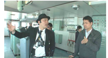
船を目的地まで安全に案内する水先人（左）

また、各船舶運航事業者は、安全管理体制を構築するうえで必要な事項を定めた安全管理規程を作成するとともに、運航管理者に加え、安全管理体制を統括管理する者として経営中枢レベルの安全統括管理者を選任することが義務付けられ、これら両名が安全管理規程の遵守と安全管理体制の構築について中心的な役割を果たすこととなっている。全国の運輸局等に配置されている運航労務監理官は、各船舶運航事業者の