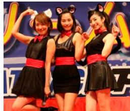
にゃんボートガールズ