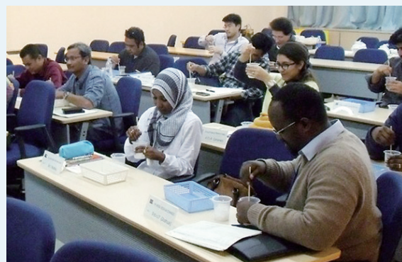
外国人向けの出前授業も実施中