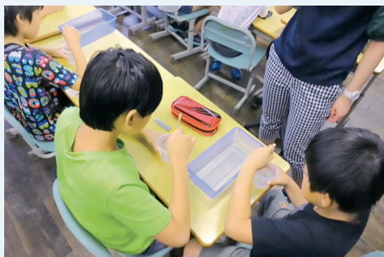
ティッシュの溶けにくさを実験を通して体感

管清工業株式会社は、平成19年以降、小学校等で無料の出前授業を継続的に実施し、これまで654箇所、43,248人に対して授業を実施しました（平成29年7月末累計）。現在は外国人向けの授業も実施しており、受講生が母国の一般市民（特に子ども）に下水道の重要性や役割をPRできるよう取り組んでいます。