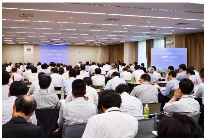
シーズ説明会の様子