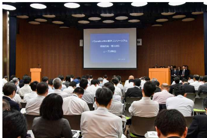
ニーズ説明会の様子①