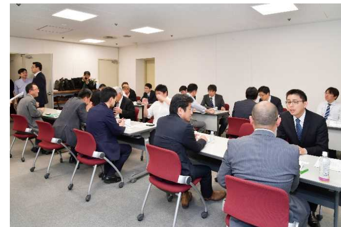
発表後の追加質問会場の状況