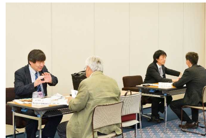
発表後の追加質問会場の状況