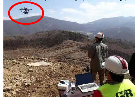
3Dデジタルカメラ(ドローン等)