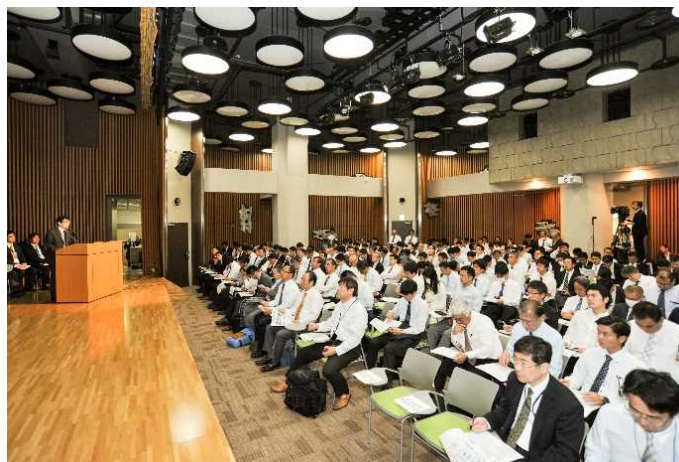
ニーズ説明会の様子②