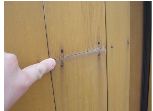
難燃処理薬剤の析出事例(白華現象) (左記の建築事例とは別件)