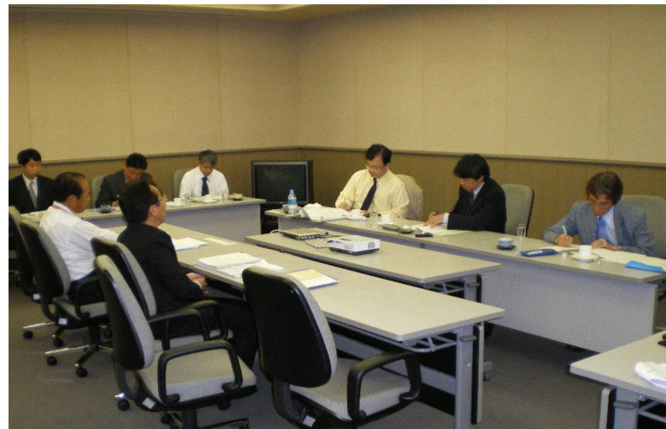
運輸安全マネジメント評価の実施の様子