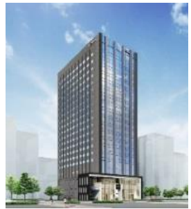
【特例事業の活用事例】 旧耐震のホテルを建て替え、環境性能の高いホテルを開発