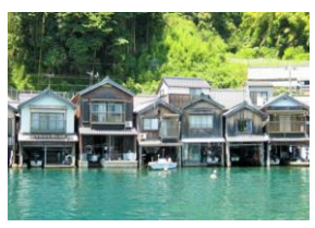
舟屋をカフェ・宿に改装して運営（伊根 油屋の舟屋「雅」）