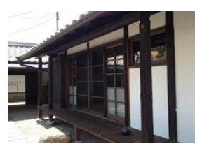
古民家を宿泊施設に改装して運営（明日香村おもてなしファンド）