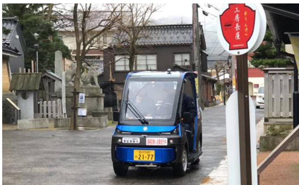
実証実験車両外観

○出発式内容：テープカット、試乗（デモ走行）等を予定。 出発式の内容は、天候等により変更となる可能性があります。