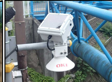
No.11 富士通・沖電気・河川情報センター