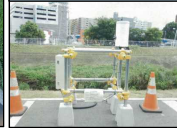
No.2 河川情報センター・応用地質