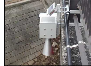
No.12 NECネットズエスアイ