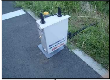
No.6 坂田電機・応用地質・NTTドコモ