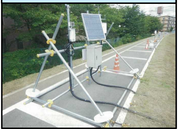
No.9 日立製作所・オサシ・テクノス