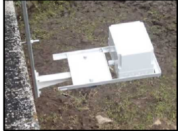
No.8 日本無線・イーラスト