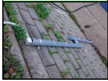
No.10 富士通・ソニック