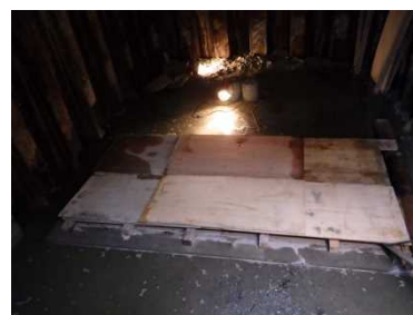
午前中作業完了状況(再現)