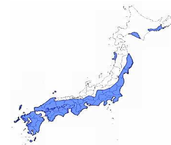
多雪区域以外の区域