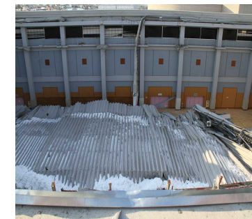
体育館の屋根崩落被害(埼玉県)