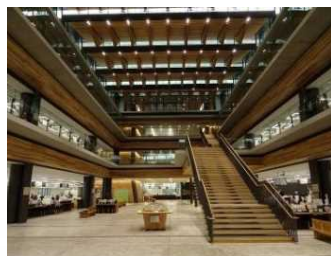
あなんフォーラム