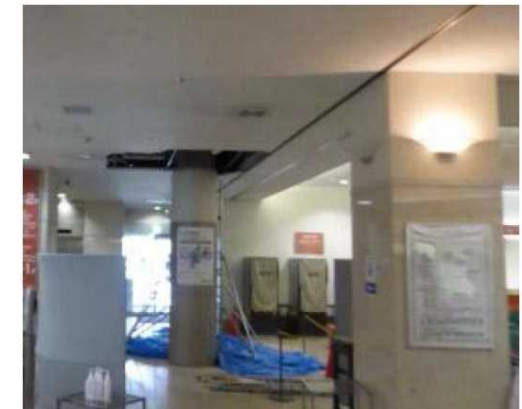
病院における天井の落下