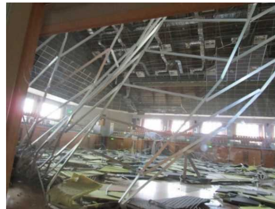
体育館における天井の損傷・照明の落下