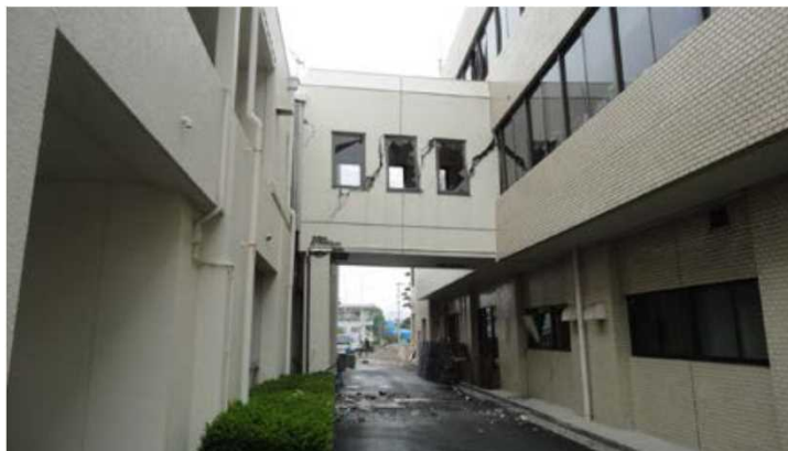
庁舎における渡り廊下の構造部材の損傷

※1 総務省 熊本地震被害報より / ※2 国土交通省調べ / ※3 厚生労働省 熊本地震被害報より