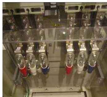
移動電源車の接続口