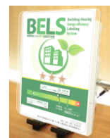
表示の例 (エントランス)