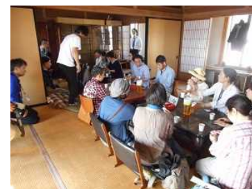
空家のマッチング事業