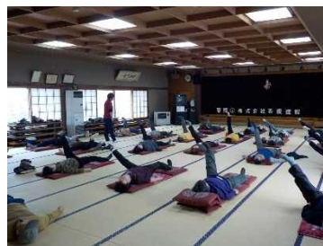
老人福祉センターにおける活動イメージ