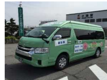
サービス券等の行政・民間協働での取組