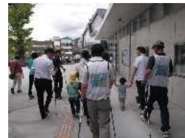
医療機関と連携した歩行指導イベント