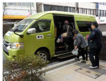
コミュニティバスターミナル整備イメージ