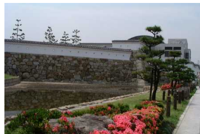
都心の低未利用地を市民が憩える公園に整備(城址公園整備事業)