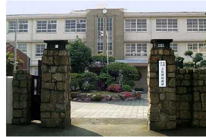
歴史的建造物を改修した文化の拠点の創生(歴史館機能整備事業)