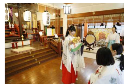
魅力あるコンテンツの発掘・展開(観光地域づくり推進事業)