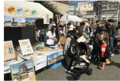
尼崎城のPRや関連イベントを通してまちづくり機運の醸成(城内まちづくり推進事業)