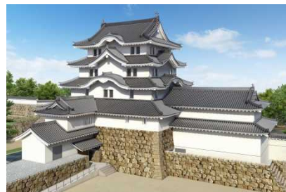
交流・観光ガイド機能具备した展示の整備(尼崎城の内部活用事業)