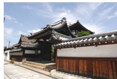
地域資源をつなぐ周遊施策の実施(観光地域づくり推進事業、サイン基本計画策定)