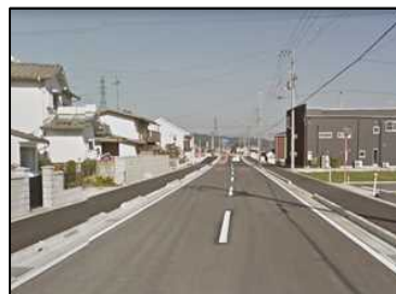
市街地の利便性及び回遊性を向上させる「都市計画道路喜多川朔日市線整備事業」