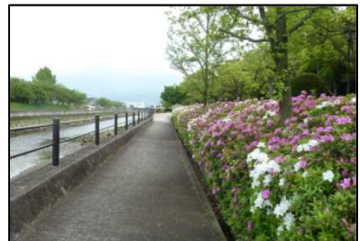
糸プロジェクトのコンセプトに沿った親水空間整備「御舟川水環境創造事業」