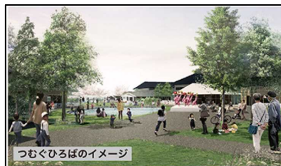
市民緑地認定制度を活用した「市民緑地等整備事業」