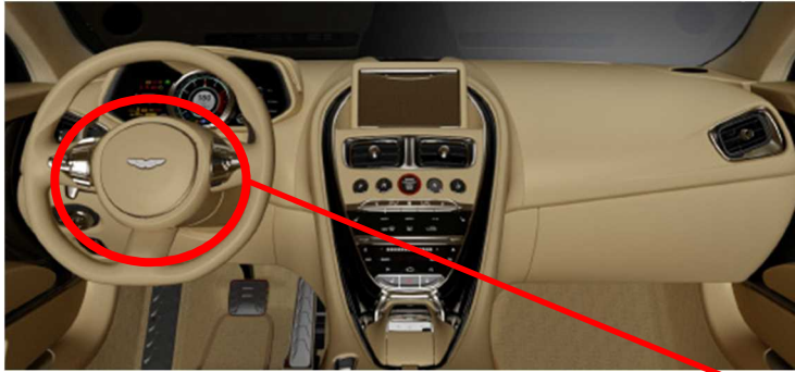
ステアリングコラムモジュール