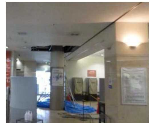
病院における天井の損傷