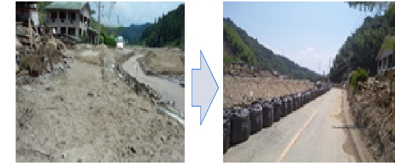
災害時の道路啓開