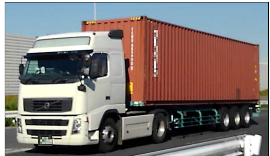
国際海上コンテナ車(40ft背高)