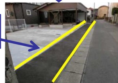
私有地（約1mほどの幅）を鶴岡市に道路用地として寄付。車のすれ違いが可能となり、住環境が改善。