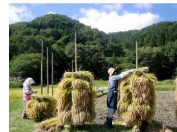
くい掛け作業（NPO法人 鳴子の米プロジェクトHPより）

米作りを農家だけの問題にせず、観光地鳴子に欠かせない田園風景を生み出す地域の営みと捉えるとともに、中山間地域の小規模農家が持続的に生産を続けていける価格を自ら設定し、この価格なら作り手が地域の田園風景を持続的に守っていけるということを、積極的に食べ手に情報提供を行っている。こうした活動は、鳴子地域の応援団を増やすことにとどまらず、食全体の価格の適正性を考える消費者意識の醸成にも貢献している。