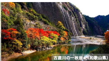
古座川の一枚岩（和歌山県）

水の里の旅コンテスト 2017 左：一般部門最優秀賞受賞企画、中・右：絶景賞受賞企画 より抜粋（ツアーで巡るスポット写真）