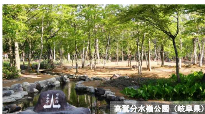
高鷲分水鏡公園（岐阜県）