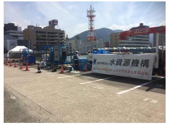
(可搬式浄水装置設置)