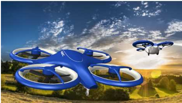
日本電気株式会社※

※ 図は大型の機体の制御技術を検証するための無人実証機。 開発した制御技術で CARTIVATOR の空飛ぶクルマの実現を支援する。