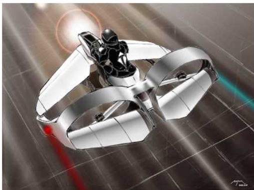
テトラ・アビエーション株式会社