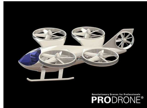
株式会社プロドローン

※ 図は大型の機体の制御技術を検証するための無人実証機。 開発した制御技術で CARTIVATOR の空飛ぶクルマの実現を支援する。