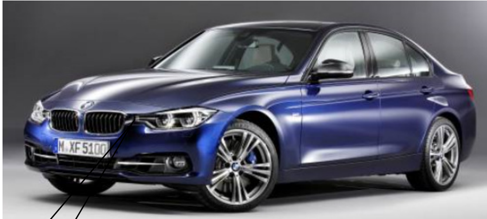
写真は左ハンドル車