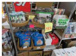
②利尻昆布ラーメン