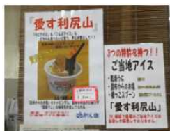
①本事業で作られたアイス