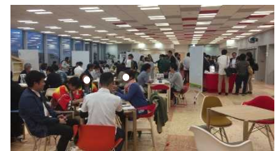
過去の「しまっちんぐ」の様子

応募方法：「しまっちんぐ」特設サイト ( http://shimatching.mlit.go.jp/ ) 内のエントリーフォームにて、民間企業等のエントリーを受け付けます。