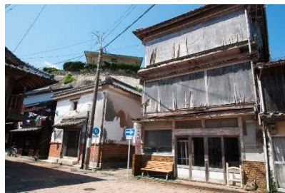
旅館等のリノベーション