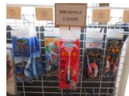
③なまこストラップ