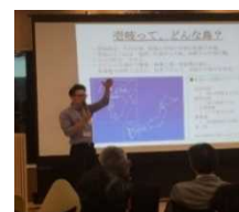
プレゼンテーション