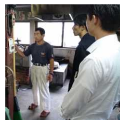
現地での意見交換