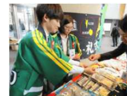
⑥離島応援マルシェの様子