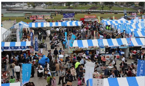
会場(赤レンガ倉庫広場)