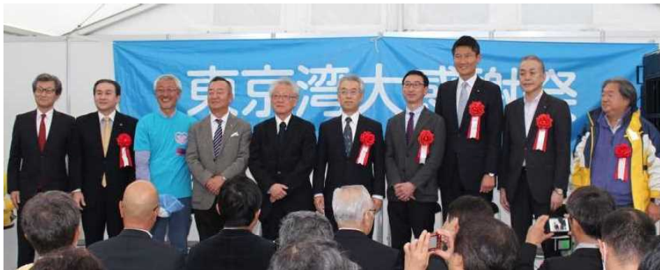
オープニングセレモニー(赤レンガ倉庫広場)