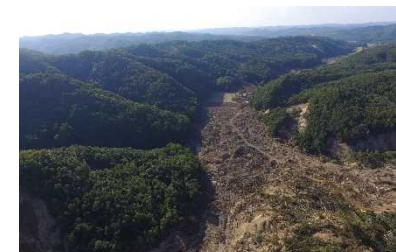
崩壊地下流の土砂堆積状況