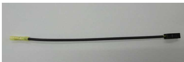
対策用リードワイヤ