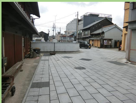
■ 余坂地区にある木戸跡地

総構えの城下町を伝える木戸(柵形)の形態を今も残す道路として、景観保全を目的に道路の美装化と電線地中化を実施しました。