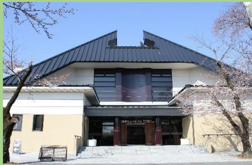
■ リニューアルした文化史料館

既設文化史料館を、犬山城と城下町を紹介する施設にするための改修計画を策定して整備しました。