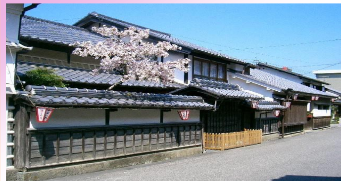
竹村家住宅（国指定重要文化財）