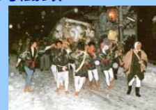
川道集落のオコナイ

オコナイにみる歴史的風致 湖北地方の代表的な民俗行事であるオコナイは、厳格なしきたりを今に伝えています。