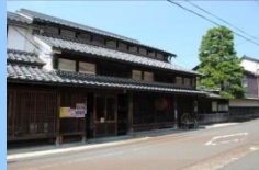
木之本宿に残る町家

北国街道木之本宿は、宿場町として、また宿場の中心にある浄信寺の門前町として発展し、今も参拝に訪れる人々の往来が絶えません。