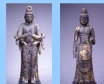
木造千手観音立像(左)と木造菩薩立像(右) 日吉神社蔵

これまで地域住民によって大切に守られてきた観音像が多く現存しており、今も人々の生活の一部として、観音信仰が受け継がれています。