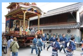
まちなかを巡行する曳山