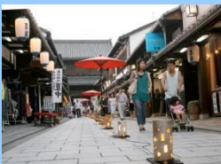
大通寺門前の町並み

大規模な伽藍を誇る大通寺には大勢の善男善女がお参りし、その門前町は買い物や食事をする人々にぎわい、昔ながらの風情が漂っています。