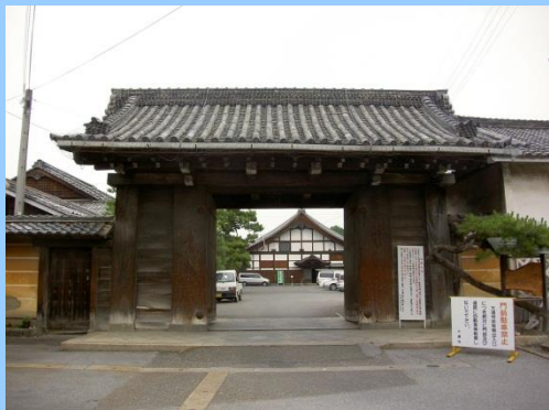
さんもんつけたりさんろう

大通寺の台所門、鐘楼、山門附山廊等を歴史的風致形成建造物に指定し、破損の著しい屋根等の保存修理を支援します。 (いずれも市指定有形文化財)