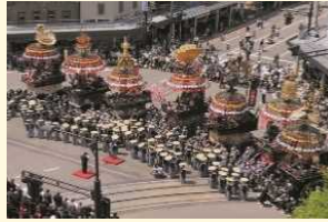
高岡御車山祭の様子 ▶

重要有形民俗文化財である「高岡御車山祭」の山車は、金工技術や漆工技術などの工芸技術が結集したものである。この山車について保存修理を実施し、それらの工芸技術等の継承につなげるものである。