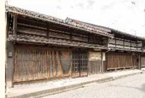
吉久伝統的建造物群保存地区 ▶

重要伝統的建造物群保存地区である山町筋、金屋町、吉久において、伝統的建造物の修理や非伝統的建造物の修景事業を実施し、歴史的な町並みの保全を図るものである。