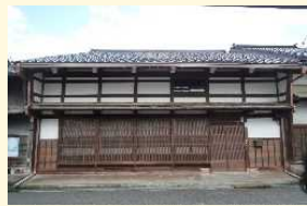
歴史的風致形成建造物の例 ▶

登録有形文化財をはじめとする市内の町家等を歴史的風致形成建造物に指定し、修理を実施し、歴史的建造物の保存と活用を図るものである。