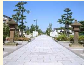
ストリート構想に位置付けられている通り ▶

ストリート構想に位置付けられている通りにおいて、関係する歴史的風致を堪能できるようなルートを設定し、最新技術等を用いてその地域の歴史や文化に触れる機会を提供することで、「歩いて楽しいまちづくり」の推進を図る。