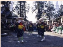
齋庭での早乙女の舞

御田祭は田植え神事として、現在も田植え前に英彦山詣でを行い、奉幣殿前に齋庭を設け、英彦山権現に豊作祈願をする情景がある。