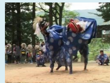
奉納される獅子楽

野田獅子楽は、加茂神社で五穀豊穡への神徳に感謝し、神霊の慰め奉るため舞われ、楽を打つ子供達の目は生き生きと輝き、村を担っていく新しい息吹が感じられる。