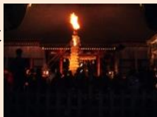
齋庭に建てられた柱松

柱松神事は奉幣殿前の齋庭に建てられた柱松に浄火が灯される中、平穏成就に合掌する人々の情景がある。