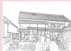
公開活用のイメージ