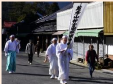
御潮井採り一行の往来

御潮井採りは九里八丁の道程を往來し、神社を神事参詣したり、持ち帰った御潮井で参道沿いの銅鳥居をはじめ、門前山中を清めぬいする情景がある。