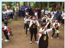
奉納される子供楽打ち

落合獅子楽は、神社境内において子供楽打ちと獅子舞が奉納され、大祖神社や高木神社への一年の祈念の気持ちが感じられる情景が見られる。