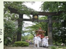
銅鳥居を取る御神輿

高住神社は牛馬信仰の中心地として、六角形の蓮華輿様を成す神輿巡幸や牛くじが行われ、農村部から多くの参詣者を集めている。