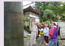
現地見学のイメージ

添田町の歴史に関するテキストを作成するとともに、小・中学校への学芸員等の派遣、現地見学等を実施する。