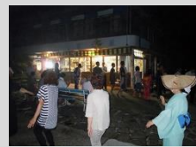
闇夜に踊られる彦山踊り

彦山踊りは報恩寺跡境内などで踊られ、三味線や笛、太鼓の音頭、口説き手の声が闇夜に溶け込み、菅笠姿の踊り手のしなやかな足運びから、深山にも「みやこ情緒」が感じられる。