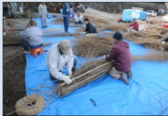
■松明作り(滝山寺鬼祭り)

民俗文化財の調査や記録、情報発信、また民俗文化財の活動を支援し、文化財の保存・継承及び地域の活性化を促進する。