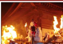
滝山寺鬼祭り(火祭り)▶

鎌倉時代、源頼朝の祈願に始まると伝えられている滝山寺鬼祭りは、旧暦正月7日に行われる火祭りで、重要文化財の滝山寺の境内地を舞台に鬼が乱舞する勇壮な祭りとして、地域に受け継がれている。