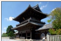
たいじゆじ 大樹寺三門▶

壮嚴な佇まいの松平氏・徳川家ゆかりの寺社を中心に、家康公の偉業を称える様々な顕彰活動や伝統行事が行われ、郷土の英傑を輩出した生誕地として市民の大きな誇りとなっている。