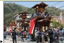
すが 須賀神社から神明宮への祭礼山車巡行▶

市東部山地にある額田地区では、自然条件に適応し営まれてきた様々な民俗行事が社寺や集落を舞台として伝えられ、個性豊かな山里のくらしが今も息づいている。