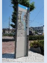
■まちなか案内サイン(吹矢橋公園)

歴史文化資産の周辺など来訪者の多い場所において、歴史文化資産の紹介や観光ルート等に関する案内板の新設・改修・修繕を行う。