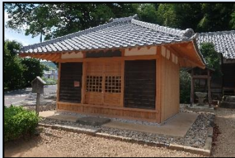
■歴史的風致形成建造物(修景後)

景観重要建造物又は歴史的風致形成建造物の外観の保全に係る修理・修景に対して支援する。