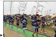
六ツ美悠紀斎田お田植え踊り▶

古くから農業が盛んな六ツ美地区には、「御田扇祭り」、「六ツ美悠紀斎田お田植えまつり」の稲作儀礼が受け継がれ、田園地帯の集落の風景に農作業や祭りを行う人々の営みが調和している。