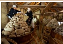
味噌蔵での石積み▶

旧東海道を挟んで建つ2軒の老舗が昔ながらの伝統製法により製造する豆味噌は、かけがえのない故郷の味であり、まちを歩くときほのかに漂う味噌の香りとともに、蔵造りのまちなみ景観が風情を漂わせている。