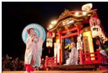
のみしんめいでう 能見神明宮の山車舞台での奉納の舞▶

江戸時代の町割りの一部や社寺の境内がそのまま残る旧岡崎城下を舞台に、当時から連続と行われてきた華やかな祭りが、往時の賑わいを感じさせている。