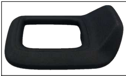
基準不適合発生箇所