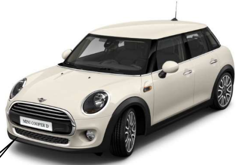
写真は左ハンドル車