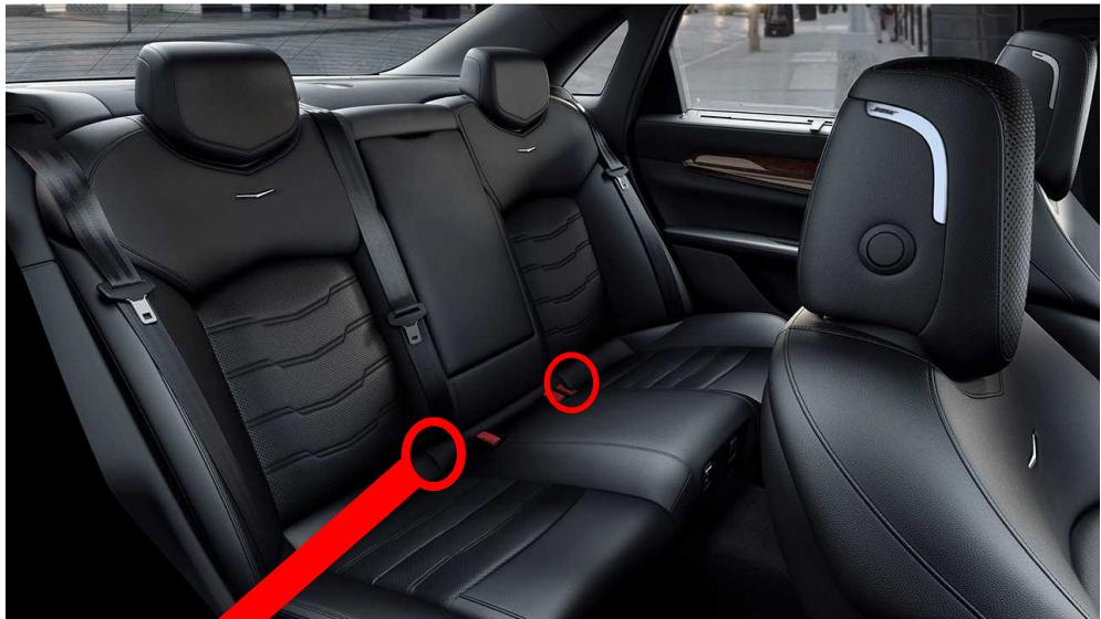
基準不適合発生箇所