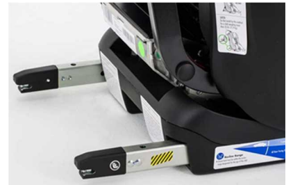
I S O F I X 取付装置ラッチ (参考)