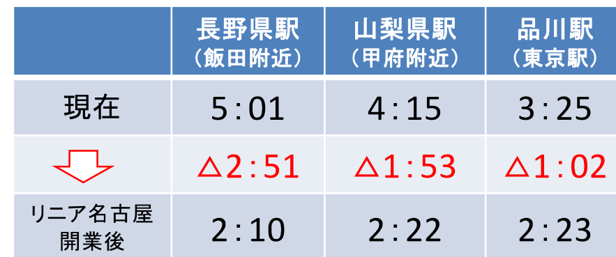
《福井駅からリニア沿線駅への移動時間》 (福井県試算)

※現行最速の所要時間をもとに、新幹線と特急との乗換えを10分、新幹線とリニアとの乗換えを15分として試算