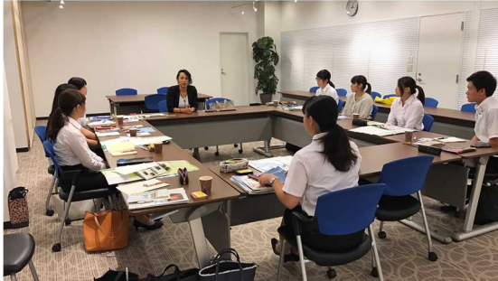
図1「事前学習会の様子①」