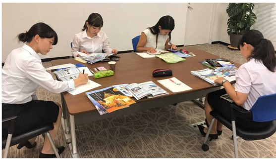
図2「事前学習会の様子②」