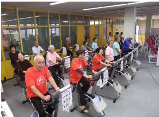
市民交流センター内の健康運動教室

一方、介護認定率は全国・県平均より低く推移し、2008年以降は県内3位以内を維持。また介護給付費（1人あたり月額）は、2010年から県平均との差が拡大し抑制されている。後期高齢者医療費（1人あたり年額）は、2011年から2014年まで減少傾向、国平均とも約20万円の差があり抑制されている。