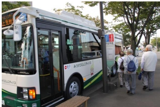
市内を循環するコミュニティバス