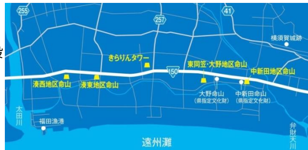
「平成の命山」の位置（袋井市パンフレット「袋井の命山」より）

また、それ以降の3地区の命山の用地検討にあたっては、津波から逆方向に歩いて逃げる前提で、津波浸水区域の市民を広くカバーするために、命山を設置すべき場所をシミュレーションしました。その結果、各地区の候補地は1～2箇所の農地等に限られることが分かり、また当該農地の所有者にも命山の必要性は共有されていたため、農地を命山用地に転用することに所有者の同意が得られました。