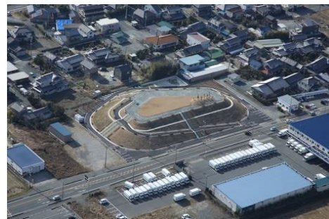
まちの中に整備された命山（湊東地区）