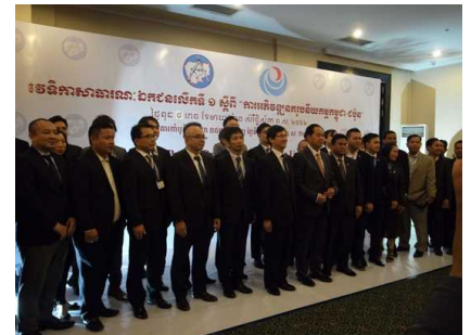
会合に参加した両国政府関係者