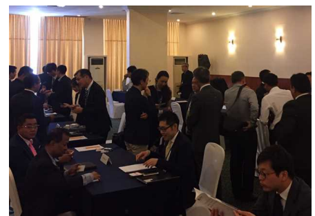
ビジネスマッチングの様子