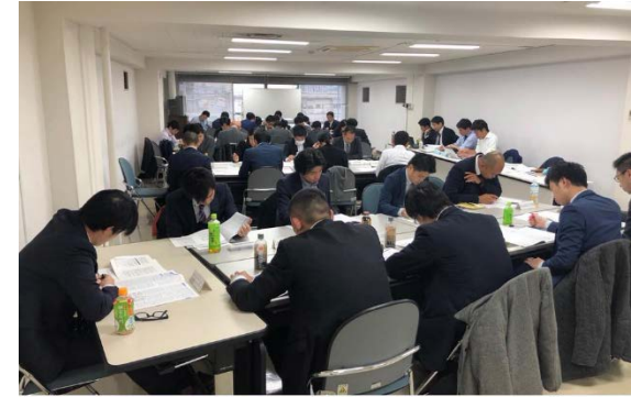
安全委員会(職種横断)