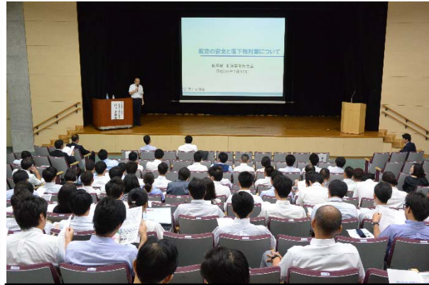
安全シンポジウム