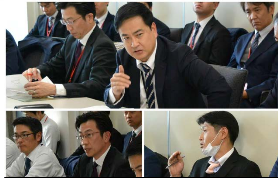
国土交通省航空局との政策協議