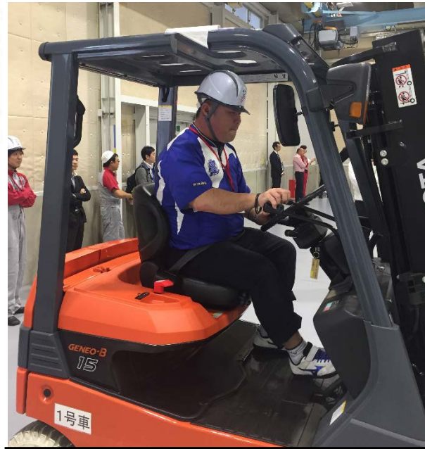
フォークリフト運転競技会