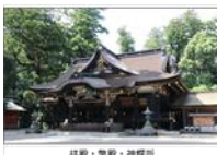
拝殿・幣殿・神饌所

下総国の一宮といわれ古くより尊崇を集める香取神宮では、御田植え祭などの年中祭典・神事その他、12年に一度式年神幸祭が行われる。