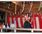
十二座神楽奉納の風景(早切)

各所の神社で奉納される十二座神楽。猿田彦命に始まり、素戔鳴命で終わる12の演目が神楽殿で奉納され、見物人で大いに賑わう。