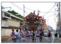
本町通りをゆく屋台

小見川の町並みで行われる祇園祭(7月中旬)で、鎮守須賀神社の氏子町内6台の屋台が賑やかに曳き廻される。