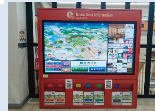
看板に内蔵されたWi-Fi機器