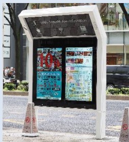
案内標識の新規設置