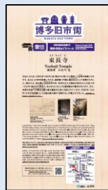
意匠デザイン (翻訳含む)