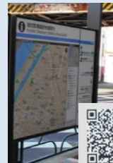
看板と関連したウェブページの作成