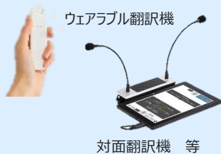
ウェアラブル翻訳機