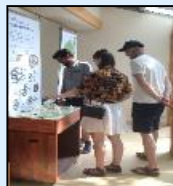
掲示物の多言語化