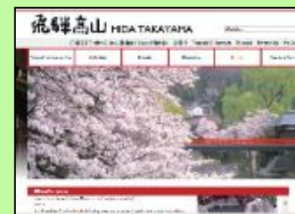
ホームページ (スマートフォン対応含)