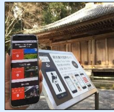
多言語案内・翻訳システム機器 多言語音声ガイド