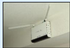
無料公衆無線LAN環境の整備