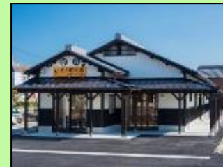
観光拠点情報・交流施設の整備・改良等 ※トイレの洋式化及び清潔等機能向上を含む