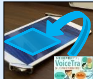
多言語案内・翻訳用タブレット端末