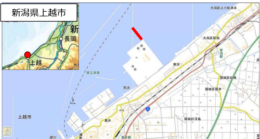
国土地理院地図（電子国土Web）( http://maps.gsi.go.jp )をもとに国土交通省作成