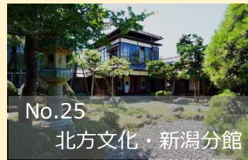
No.25 北方文化・新潟分館