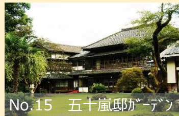
No.15 五十嵐邸ガーデン