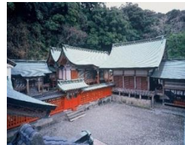
【大分市】柞原八幡宮