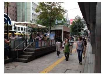
オープンカフェ等の施設の整備等によるまちの賑わい、交流の場の創出(イメージ)